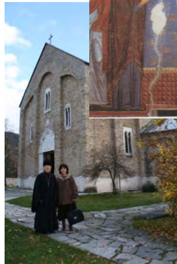
ストゥデニツァ修道院の生神女進堂聖堂(11世紀末建立)とフレスコ。青が印象的。ユネスコ世界遺産。

思います。ギリシア聖歌の音階は1オクターブを72分割して構成されており、西洋音楽の平均律に慣れた耳にはなかなか馴染みにくいのですが、セルビアのものは私たちの耳にも聞き取りやすい音階に変化していました。